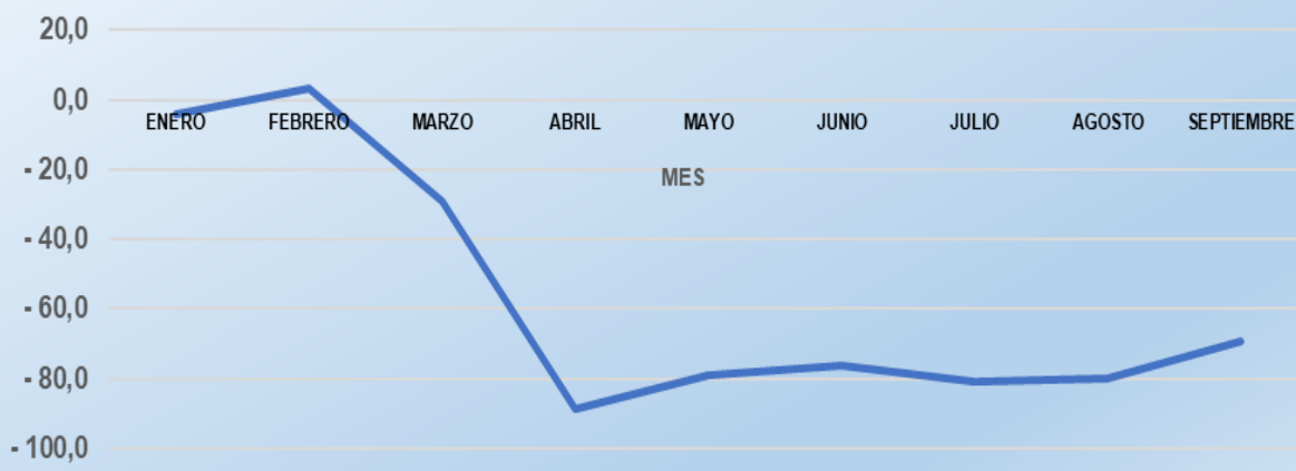
GRÁFICO N°3 COSTA RICA: DIRECCIÓN GENERAL DE AVIACIÓN CIVIL AEROPUERTO INTERNACIONAL DANIEL ODUBER QUIRÓS TASA DE CRECIMIENTO DE OPERACIONES, POR MES PERÍODO: 2019-2020

En el Aeropuerto Daniel Oduber se observa un inicio de recuperación, sin embargo, más débil que en el Juna Santamaría, ya que este aeropuerto es especialmente de turistas y para lograr obtener la cantidad de pasajeros como antes del COVID-19, tendrá que pasar varios meses, el turista tiene que recuperar la confianza y la economía para viajar, se espera que con la vacuna y la reactivación económica mundial poco a poco se logre recuperar la actividad turística del país.