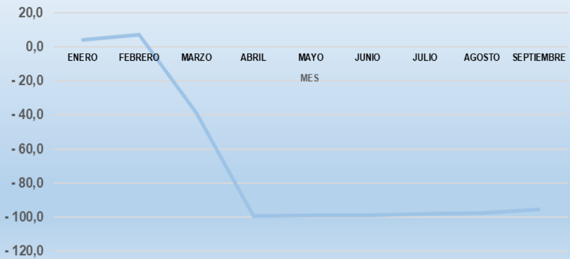
GRÁFICO N°1 COSTARICA: DIRECCIÓN GENERAL DE AVIACIÓN CIVIL AEROPUERTO INTERNACIONAL JUAN SANTAMARÍA TASA DE CRECIMIENTO DE PASAJEROS POR MES. PERÍODO: 2019-2020