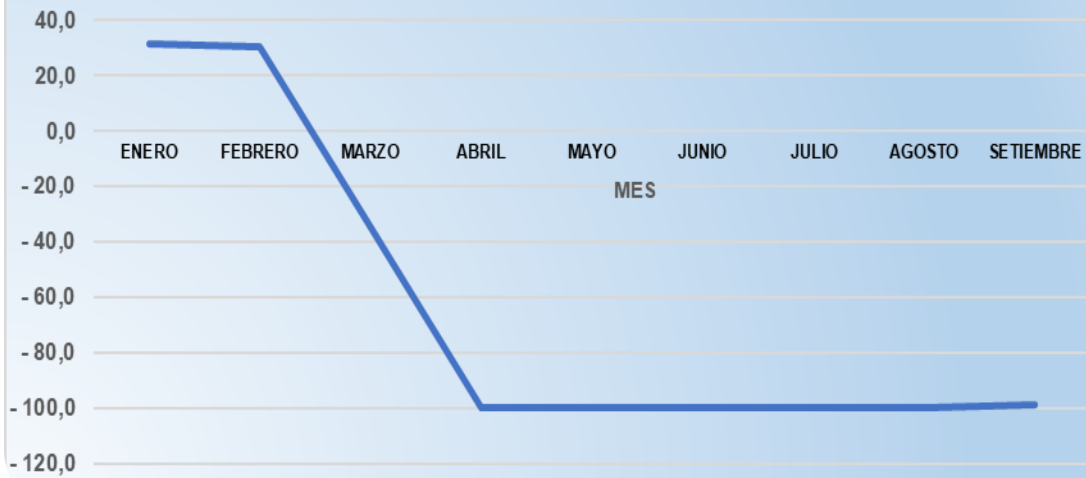
GRÁFICO N°3 COSTA RICA: DIRECCIÓN GENERAL DE AVIACIÓN CIVIL AEROPUERTO INTERNACIONAL DANIEL ODUBER QUIRÓS TASA DE CRECIMIENTO DE PASAJEROS INTERNACIONALES POR MES PERÍODO: 2019-2020